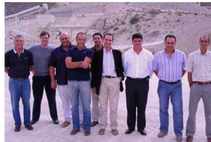
JUNTA DIRECTIVA 07.10