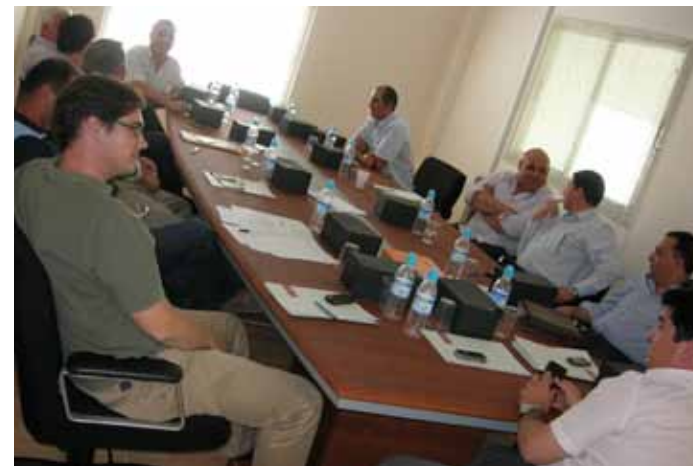
JUNTA DIRECTIVA 02.06