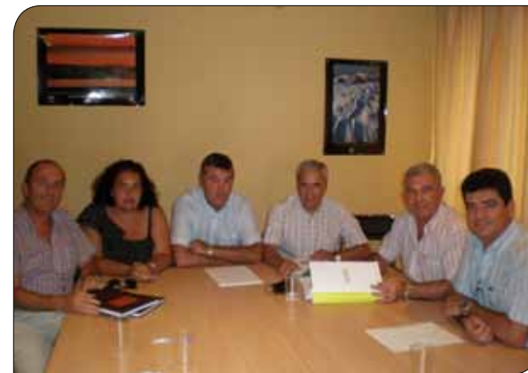
Málaga, 8 de julio Reunión del Panel Nacional de Áridos y Minería

Otro tema muy interesante que está abordando CONFEDEM es el del factor de agotamiento, pues el Ministerio de Economía y Hacienda no considera a toda la explotación para su cálculo y CONFEDEM estima que sí debe computarse toda.